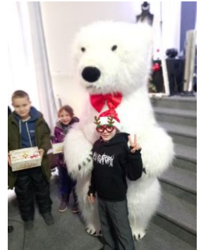
06.01.2024 – Инсталляция «путешествие в Вифлеем», г. Калуга