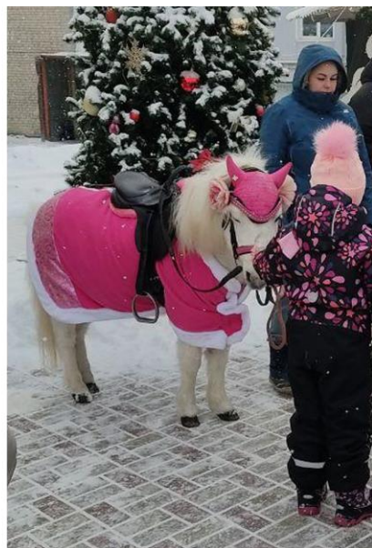
10.01.2024 - Рождественская елка для детей, г. Суворов, Тул. обл.