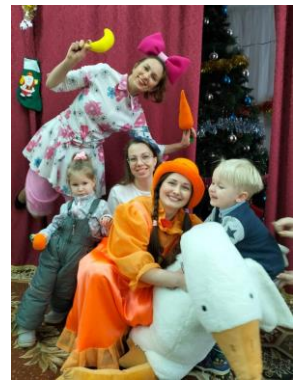
24.01.2024 - Рождественская программа для детей из центра социальной помощи семьям и детям «Надежда», г. Калуга.