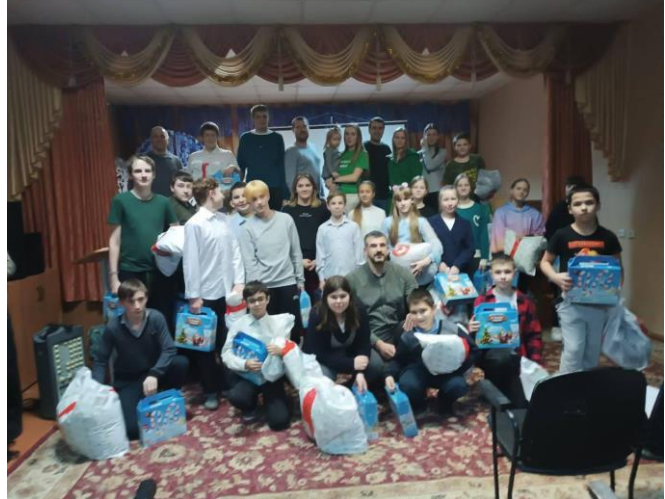
16.01.2024 - Социально-реабилитационный центр для несовершеннолетних «Радуга», Дзержинский район, г. Товарково.